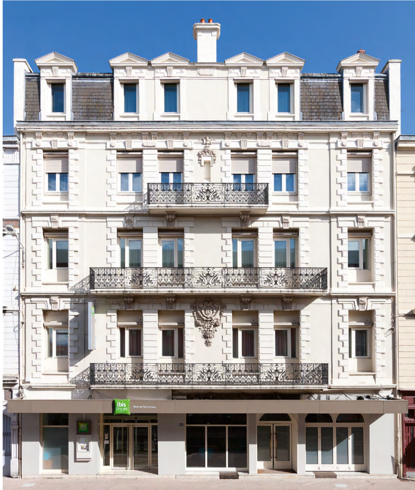
L'ibis Styles Roanne Centre Gare.

Fidèle à sa stratégie d'investissement dans l'hôtellerie économique et milieu de gamme, EXTENDAM acquiert un portefeuille de 3 nouveaux hôtels en région et en confie l'exploitation à SomnOO. Ce portefeuille comporte l'ibis Styles de Roanne (3*), l'ibis Budget de Pouilly-en-Auxois et l'ibis Budget de Marmande (2*). L'opération murs et fonds, initiée il y a quelques mois, pendant la crise sanitaire a été réalisée avec une correction de valeur liée à l'impact de la Covid-19 et apporte à EXTENDAM 177 chambres supplémentaires en hôtellerie économique.