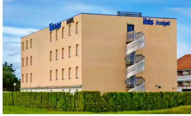
L'ibis Budget Pouilly-en-Auxois.