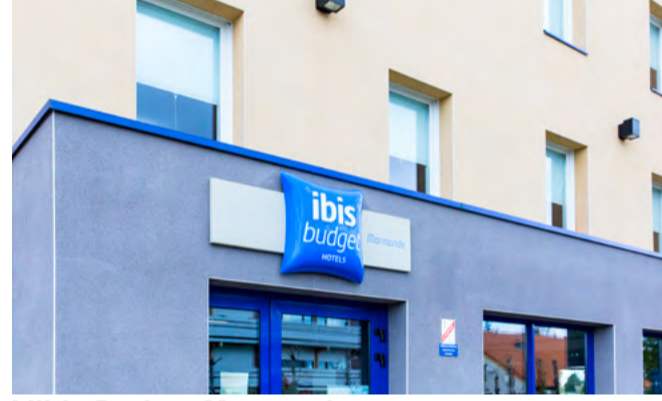
L'ibis Budget Marmande.