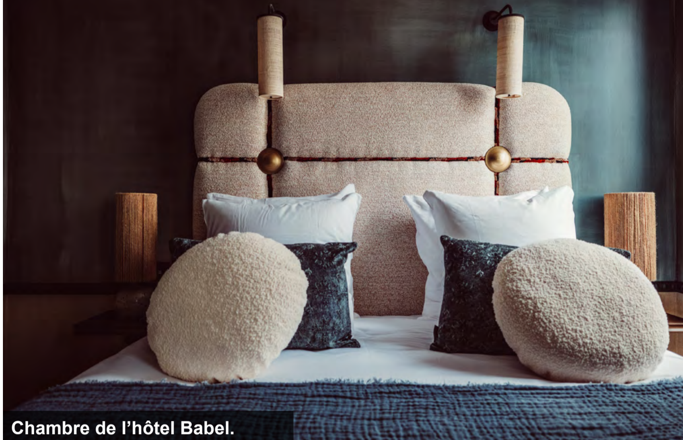
Chambre de l'hôtel Babel.

Dans une esthétique intemporelle signée Daphné Desjeux, rassemblant matériaux nobles et naturels, objets contemporains et anciens d'origines diverses, Babel emmène ses hôtes dans une atmosphère décontractée et invite au voyage, notamment grâce aux patines uniques de Rosateller. Les artistes de Belleville ont également investi l'hôtel, semant des œuvres au détour des couloirs.