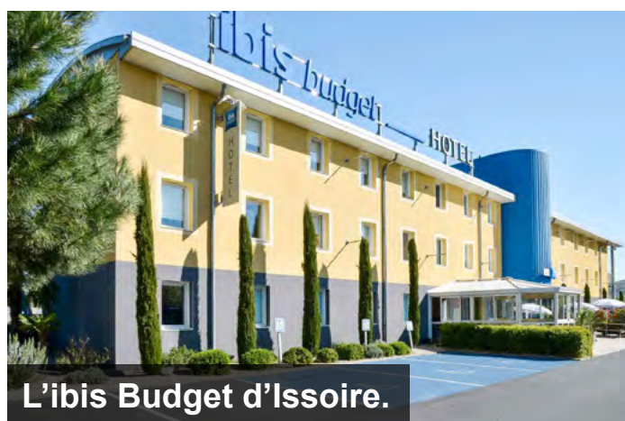
L'ibis Budget d'Issoire.