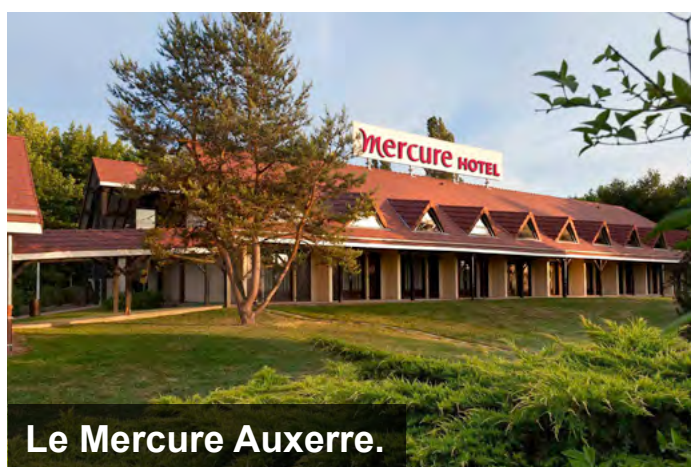
Le Mercure Auxerre.

À 40 minutes de Clermont-Ferrand et à 7 minutes du centre d'Issoire, l'ibis Budget propose 75 chambres de tailles variées. Il nécessitera de petits travaux de mise en conformité et de rénovation qui lui permettront de s'aligner sur les standards et nouvelles attentes d'une clientèle corporate et de loisirs bénéficiant de sa proximité avec le Zénith de Clermont-Ferrand et le parc naturel des volcans.