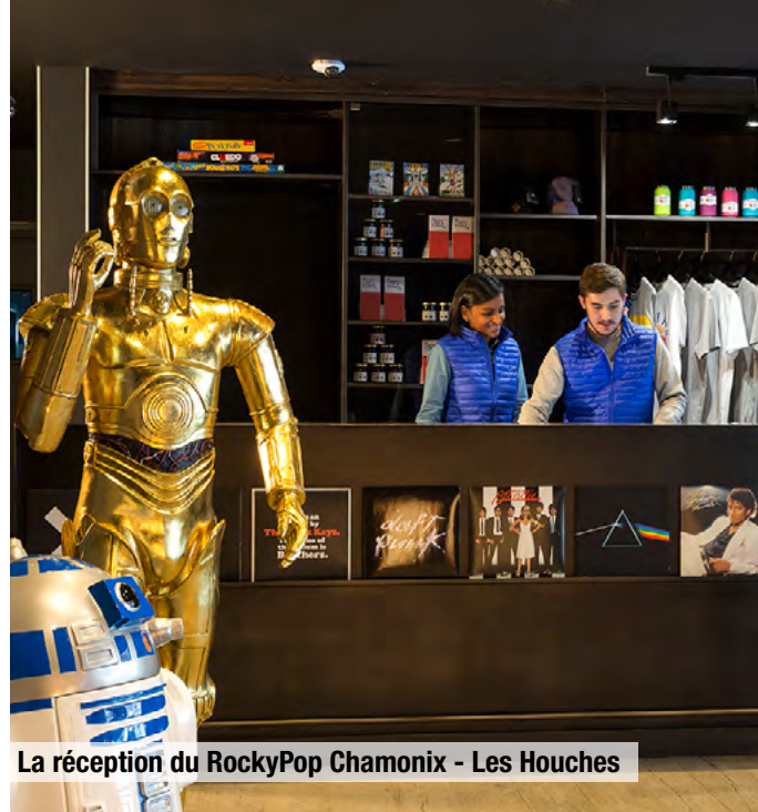
La réception du RockyPop Chamonix - Les Houches