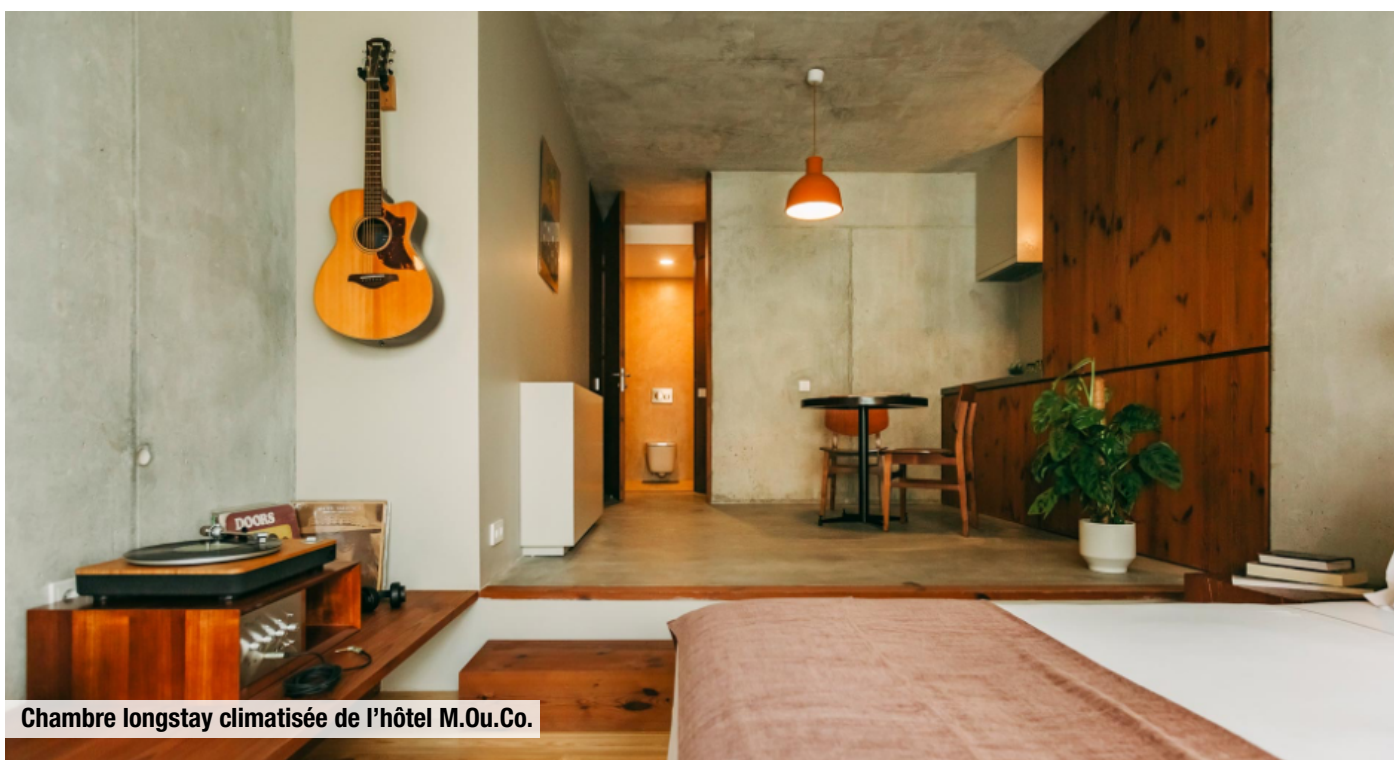
Chambre longstay climatisée de l'hôtel M.Ou.Co.

Actionnaire majoritaire de l'opération, EXTENDAM acquiert le M.Ou.Co de Porto, en murs et fonds, lors d'une première opération avec Outsite, exploitant spécialisé dans le coliving de courte durée, avec la participation de Keys REIM. L'hôtel classé 4*, propose un concept singulier autour de la musique "Stay, Listen & Play", et compte notamment 62 chambres, ainsi qu'une salle de concert de 300 places. Cette opération est une nouvelle illustration de l'émergence de nouveaux modèles hôteliers en Europe.