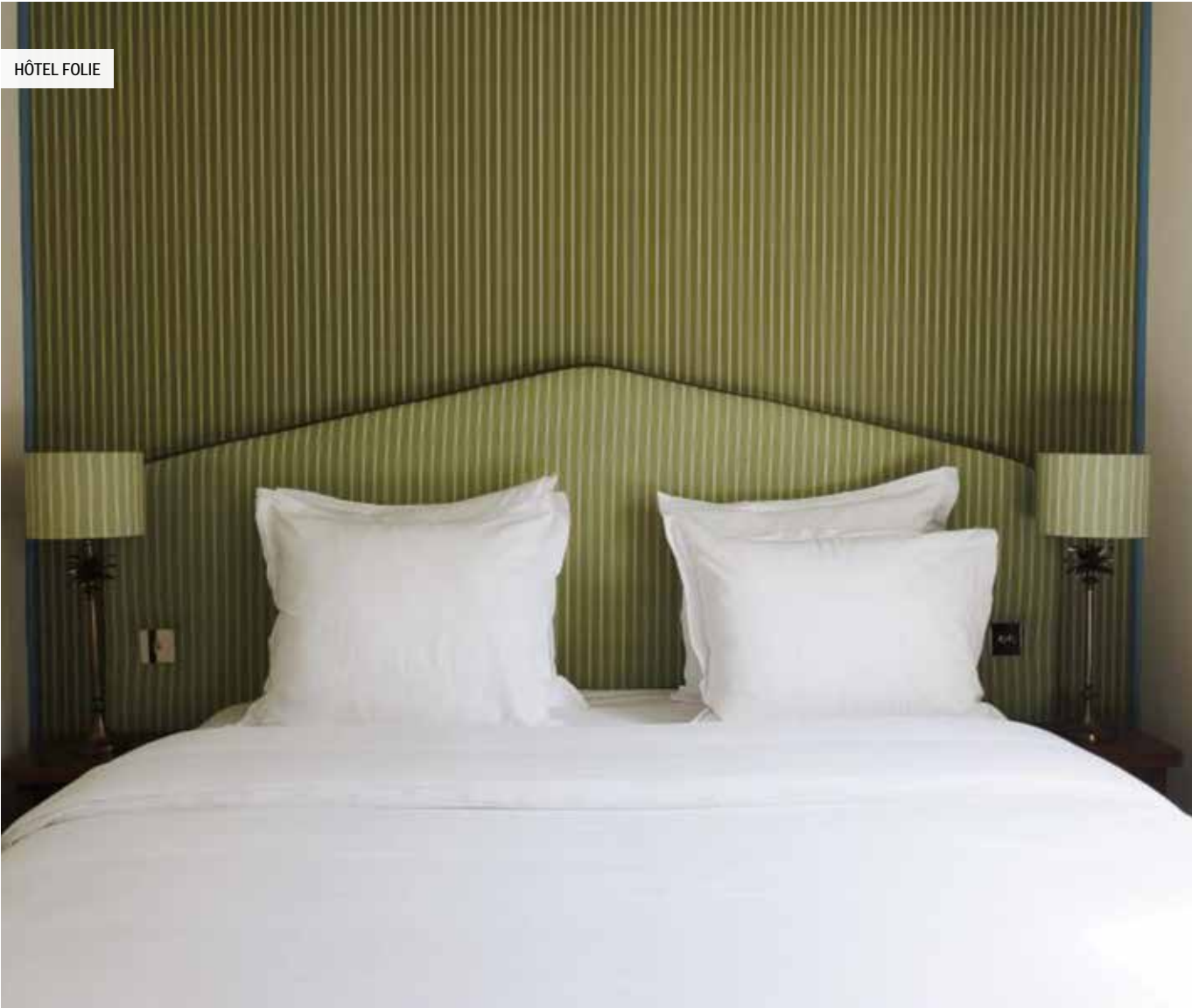
PHOTO AVANT RÉNOVATION